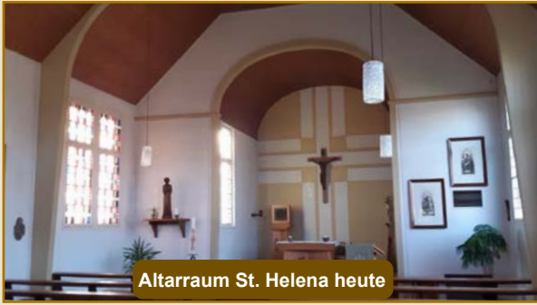
Altarraum St. Helena heute