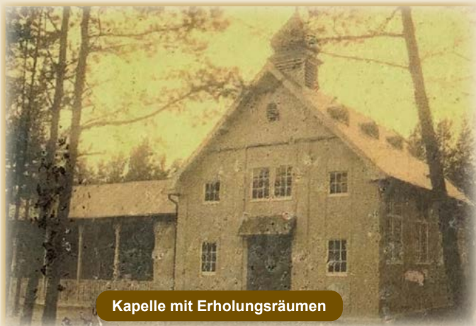
Kapelle mit Erholungsräumen

Am 1. März 1936 übernahm die nationalsozialistische Volkswohlfahrt (NSV) die Walderholungsstätte. Die NSV betrieb die Ablösung der bis dahin tätigen Clemensschwestern. Die Kapelle wurde abgebaut.