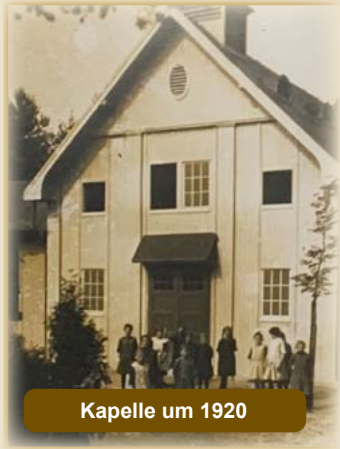
Kapelle um 1920

Die St.-Helena-Kapelle in Hemden wurde im Jahr 1920 in der Walderholungsstätte im damaligen Nadelwald zwischen dem heutigen Bahia und der Alffstraße errichtet. In der Walderholungsstätte wurden zunächst Kinder mit Tuberkuloseerkrankung behandelt, später auch Erwachsene.