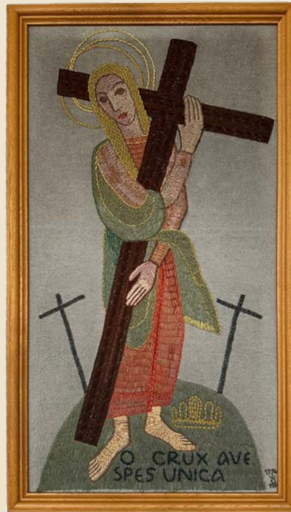
Darstellung der heiligen Helena, Wandteppich der Bocholter Künstlerin Lucy Vollbrecht-Büschlepp

Nachdem Helena sich zum Christentum bekehrte, machte sie sich der Legende nach auf den Weg nach Palästina, um dort das Kreuz zu finden, an dem Jesus Christus gestorben war. Dieses Engagement macht sie u.a. zur Schutzherrin der Schatzsucher. Viele weitere ihrer Fundstücke finden sich als Reliquien auf der ganzen Welt.