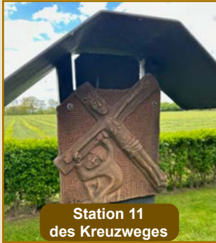
Station 11 des Kreuzweges