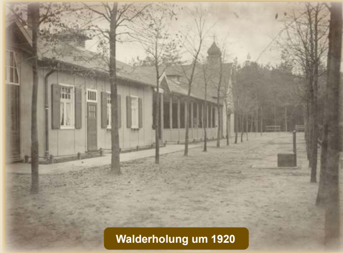
Walderholung um 1920

Seitdem ist sie neben dem Hemdener Saal ein Zentrum der Gemeinde . Seit 1991 gibt es einen Kreuzweg mit 14 Stationen und künstlerisch gestalteten Tontafeln vom Bahia bis zur Kapelle.